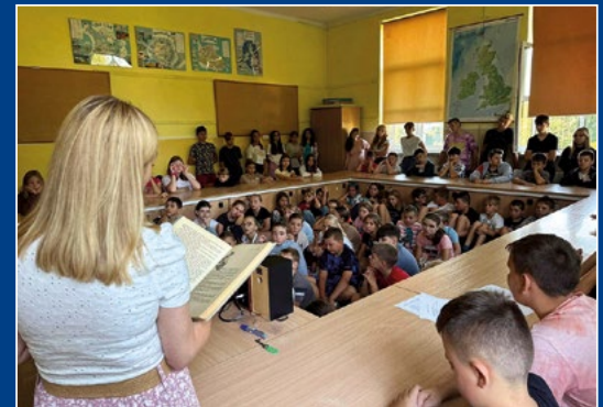
Czytamy Nad Niemnem