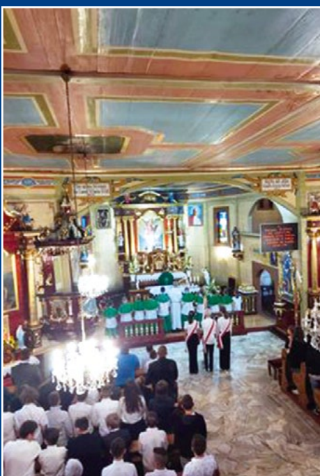
Msza Święta na rozpoczęcie roku szkolnego